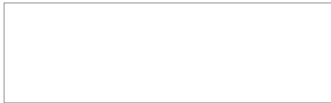
Pieczętka firmowa Sprzedawcy

Warunkiem otrzymania gwarancji w wersji rozszerzonej do 50 lat jest dokonanie przez Uprawnionego rejestracji zakupu dachówek na stronie internetowej www.gwarancja.creaton.pl w nieprzekraczalnym terminie 24 miesięcy od jego dokonania. Potwierdzeniem uzyskania gwarancji w wersji rozszerzonej do 50 lat jest informacja otrzymana przez Uprawnionego na wskazany przez niego w formularzu rejestracji adres e-mail.